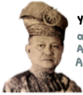
YDPA pertama almarhum Tuanku Abdul Rahman ibni Almarhum Tuanku Muhammad